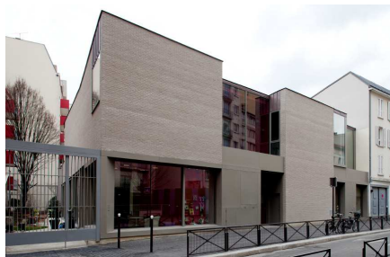
Vue de la façade

L'archivage des photographies ou leur réutilisation dans un autre cadre est interdit.