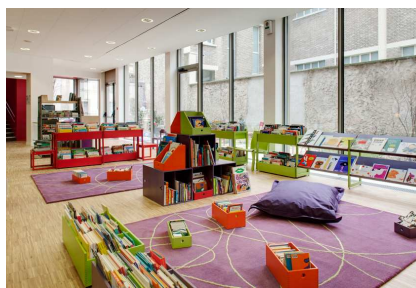
Vue de la salle de lecture, l'espace des petits