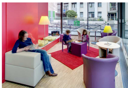
Vue de la salle de lecture