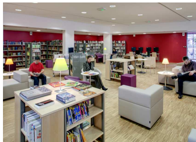
Vue de la salle de lecture