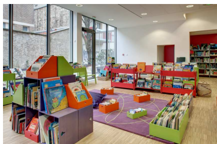
Vue de la salle de lecture, l'espace des petits